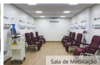
Sala de Medicação